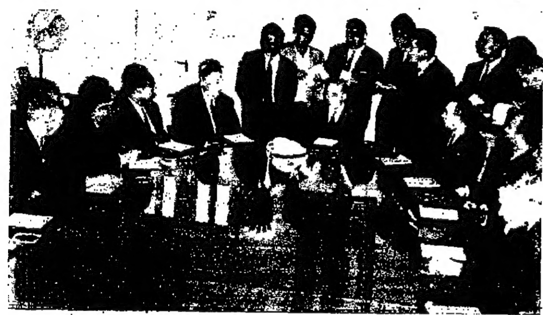
السيد بهجت القهوني رئيس الوزراء يتحدث الى أعضاء الوفد البلغاري

عمان - استقبل السيد بهجت القهوني رئيس الوزراء في مكتبه صباح أمس الوفد البرلماني البلغاري برئاسة السيد كيريل لازروف رئيس مجلس الاتحاد الوطني البلغاري كلمة رئيس الوزراء